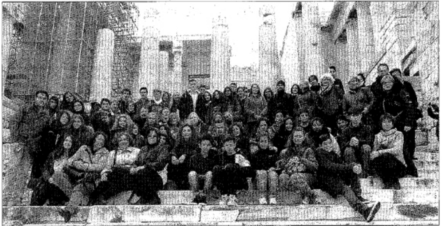
Projekto dalyviai senovės paminklo papėdėje.

Antradienio rytą visi projekto dalyviai vyko prie upės Erasinos. Padedant gamtos apsaugos darbuotojams susipažinome su upės augmenija ir gyvūnija,